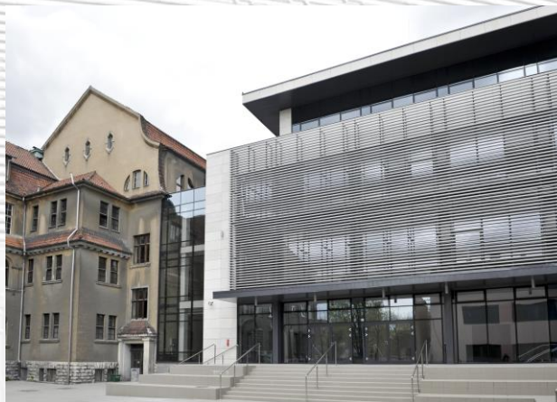
Wydział Budownictwa Politechniki Opolskiej

Koszt uczestnictwa w Konferencji obejmuje publikację jednego artykułu, jako rozdziału w monografii „Wybrane zagadnienia Inżynierii środowiska w budownictwie” (po zakwalifikowaniu go do druku przez Komitet Naukowy). Zgodnie z Rozp. MNiSZW z dnia 11.08.2012 r., Dz.U. z 2012 r., poz. 877, za autorstwo rozdziału w monografii uzyskuje się 4 pkt.